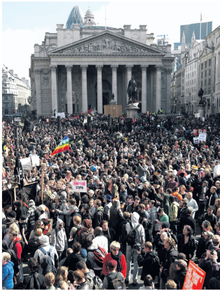
Proteste: Zum G-20-Gipfels im April marschierten Demonstranten in London auf. Damals bedachten die Staatslenker den IWF mit 250 Milliarden Dollar.

Zweitens gehört zu einer politischen Reform der internationalen Finanzinsti-